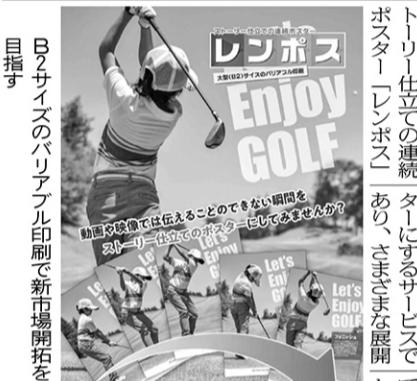
B2サイズのバリエーション印刷で新市場開拓を目指す

「Jet Press 720S」... の導入で新たな... 販路を見出すこととな... った。