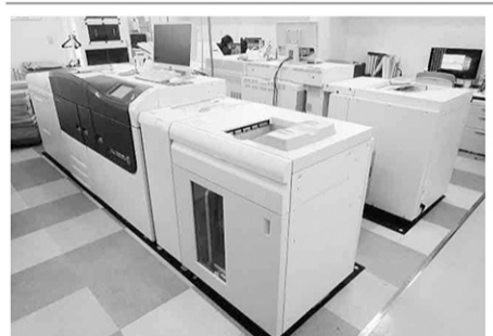
パーソナライズされた情報を付加することで差別化、小ロット生産を実現