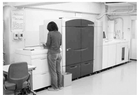
JET PRESS 720Sを含め全てデジタル印刷機を3名のパート社員でオペレートする

「Jet Press 720S」... の導入で新たな... 販路を見出すこととな... った。