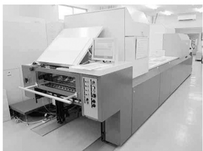
「Jet Press 720S」の導入で新たな販路を見出すこととなった

「Jet Press 720S」... の導入で新たな... 販路を見出すこととな... った。